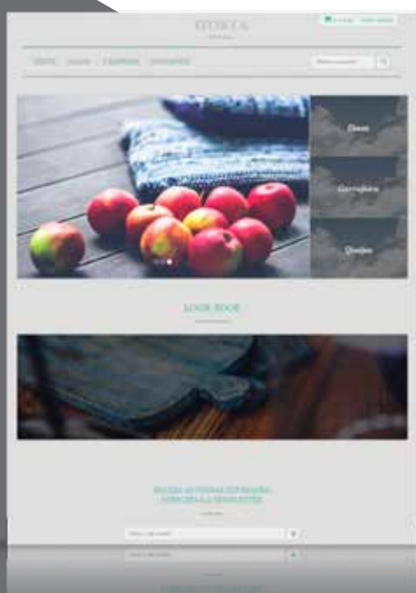
Exemplo de uma página inicial configurável no Loja Web.