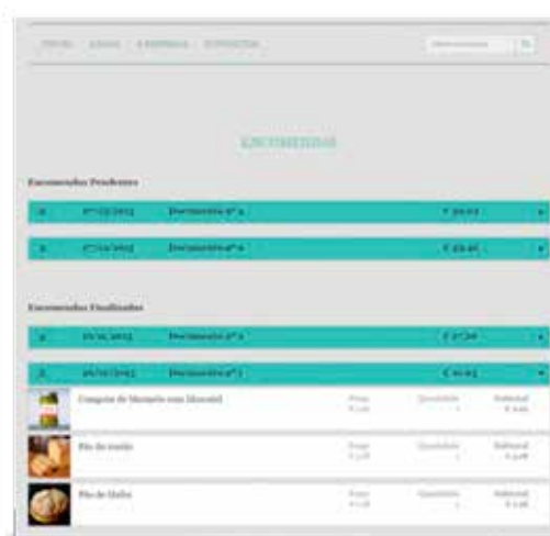
Os seus clientes podem gerir o histórico e o estado de cada encomenda.