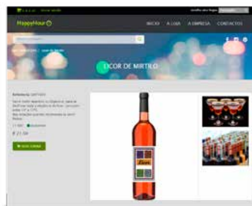
O detalhe dos produtos tem a informação que quiser.